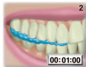
Doba tuhnutí v ústech – 1 minuta