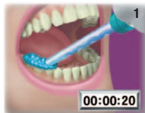
Pracovní čas v ústech – 20 vteřin

Za každých okolností si zachová svůj tvar.