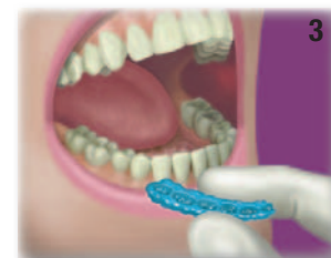
Vyjměte otisk z úst, omyjte, osušte, vydezinfikujte a zkraťte podle potřeby